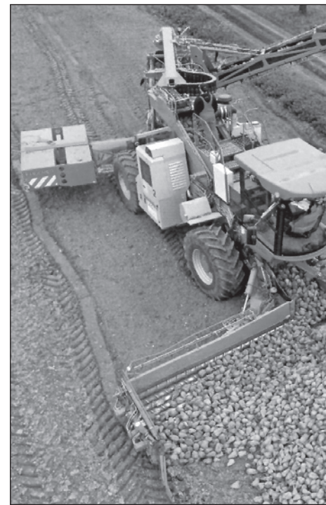
کند که اجازه ورود شکر بیشتری را بدهند، بعید به نظر می‌رسد که هند بتواند صادرکننده عمده شکر شود.